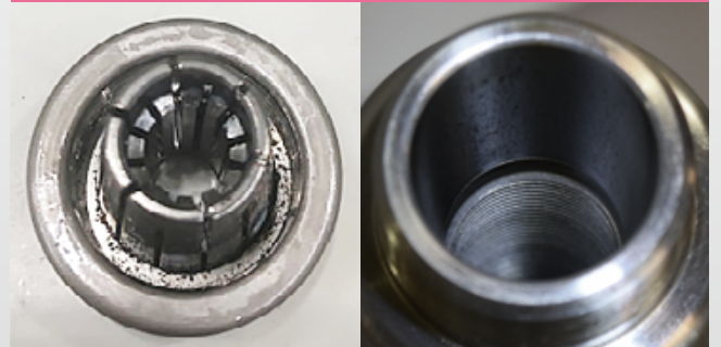
HDP-DS + HDC12A