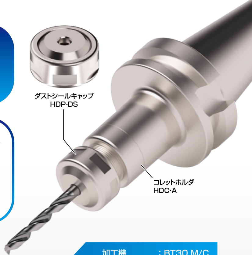
ダストシールキャップ HDP-DS